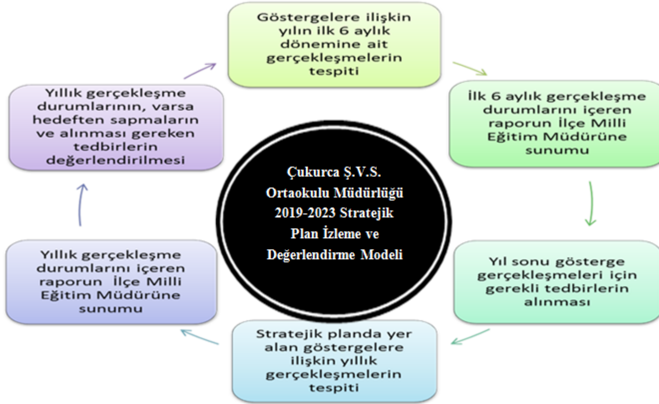
Şekil 1: Çukurca Şehit Veli Selçuk İlk ve Ortaokulu Müdürlüğü 2019-2023 Stratejik Plan İzleme ve Değerlendirme Modeli