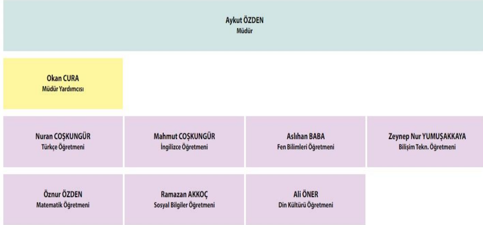
Şekil 1: Organizasyon Şeması